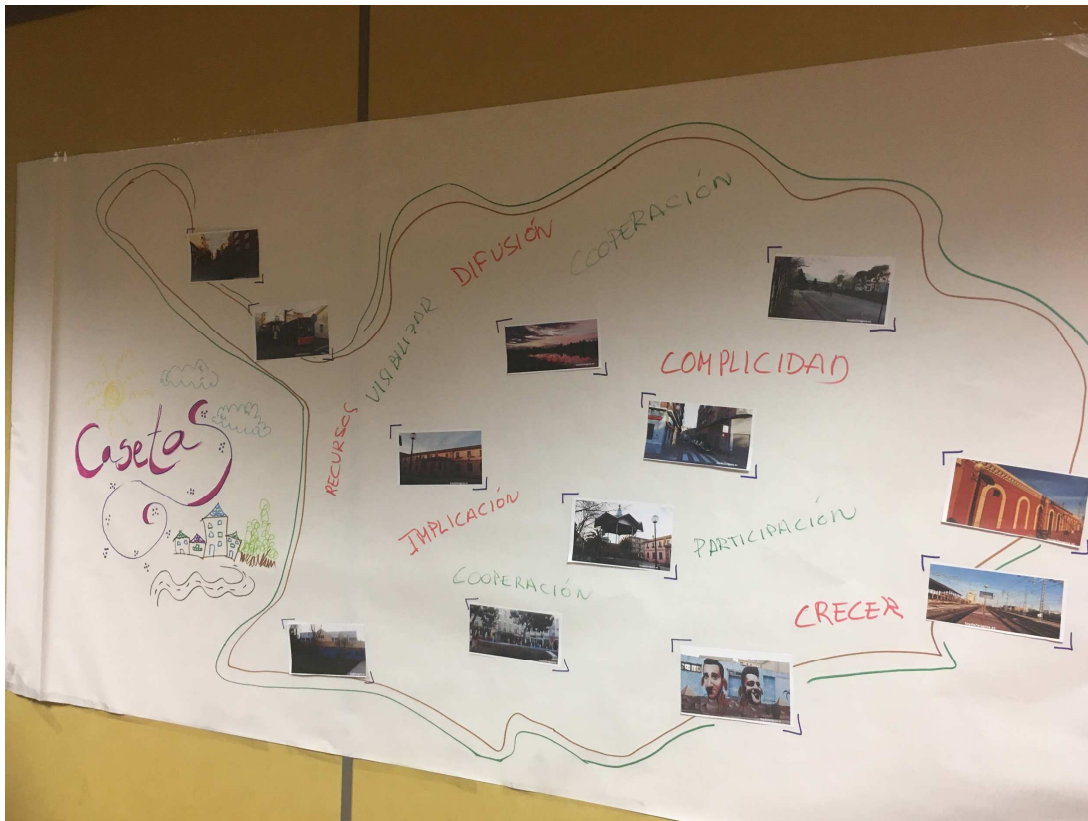
Figura 1: Mapa de Casetas con las expectativas de la jornada

A continuación mostramos una foto del mapa de casetas con las expectativas que más se repitieron, que en general, son en sí mismas algunos los objetivos de esta iniciativa