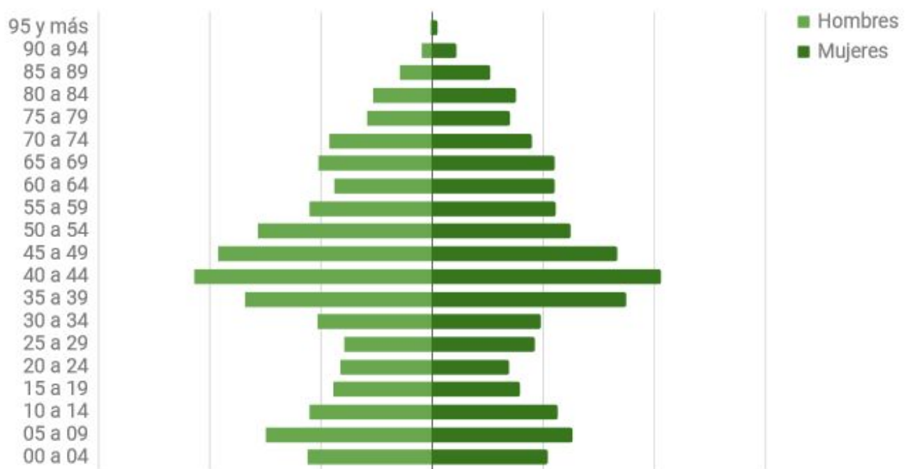
Figura 1. Pirámide poblacional de Arrabal 2016

(4)