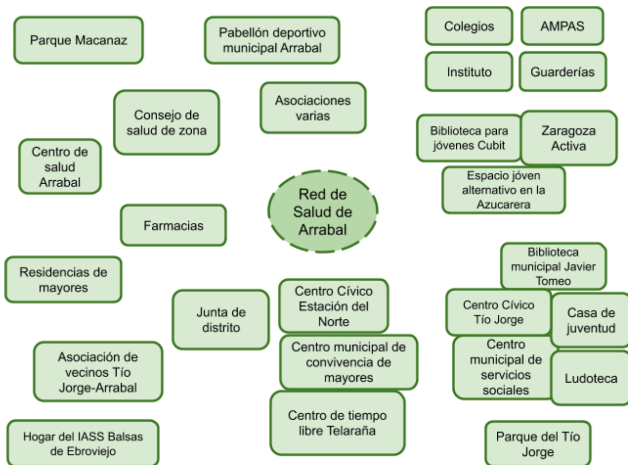
Figura 4. Mapa conceptual de recursos de Arrabal

Tras la puesta en común de los diferentes recursos del barrio, se presenta un esquema conceptual para visualizar los principales recursos identificados. (Fig. 4)